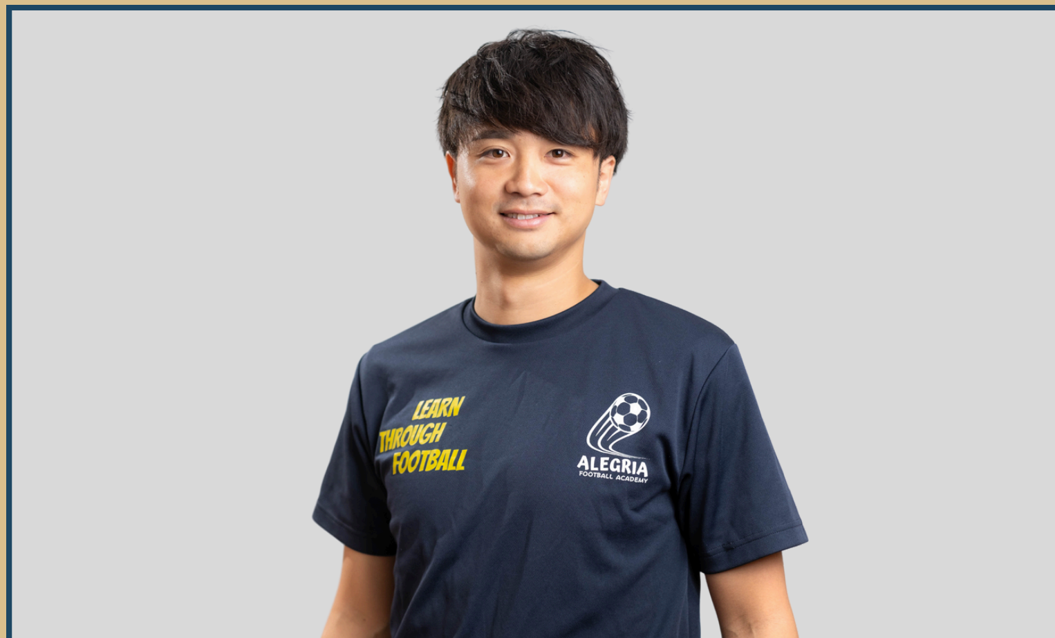
アレグリアフットボールアカデミー代表