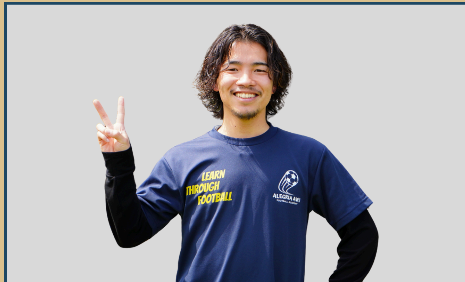
アレグリアフットボールアカデミーコーチ

サッカーを通じて得た経験や学びを活かし、子どもたちがスポーツを楽しみながら成長できる場を提供することを使命に活動しています。 サッカーは単なる競技ではなく、仲間と協力し、挑戦し、失敗や成功から学ぶことで人間として大きく成長できる素晴らしいツールです。私はその可能性を最大限に引き出し、子どもたちが技術だけでなく、協調性、リーダーシップ、そして自分を信じる力を身につけられるようにサポートしていきます！